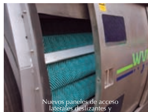
Nuevos paneles de acceso laterales deslizantes y