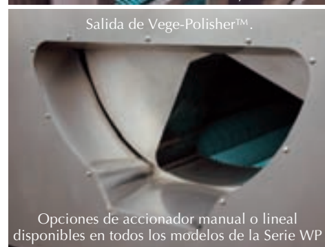
Salida de Vege-Polisher™.