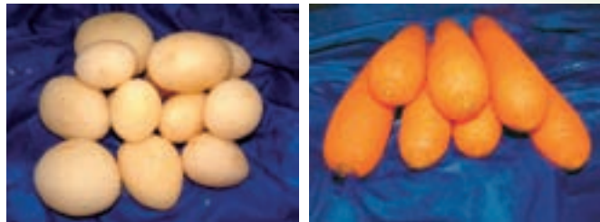
Ejemplos de patatas y zanahorias mondadas en una Wyma Vege-Polisher™.

Hemos realizado pruebas exhaustivas que han demostrado que la monda de verduras con los cepillos Wyma puede reducir significativamente los desperdicios que se generan con procesos alternativos como la monda con carborundo. El producto acabado tiene un aspecto mucho mejor que el producto mondado con carborundo, porque los cepillos no raspan el producto.