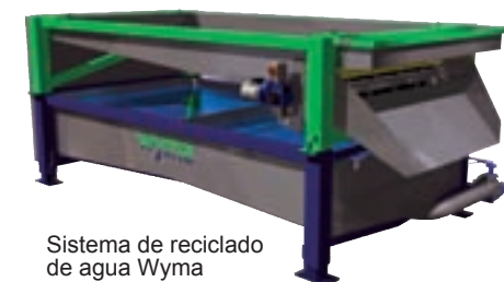
Sistema de reciclado de agua Wyma