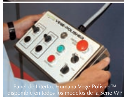
Panel de Interfaz Humana Vege-Polisher™ disponible en todos los modelos de la Serie WP